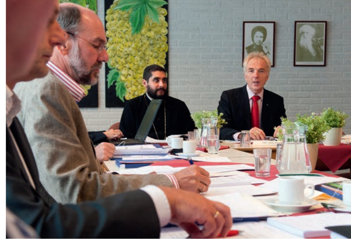
Vergadering van de Raad van Kerken