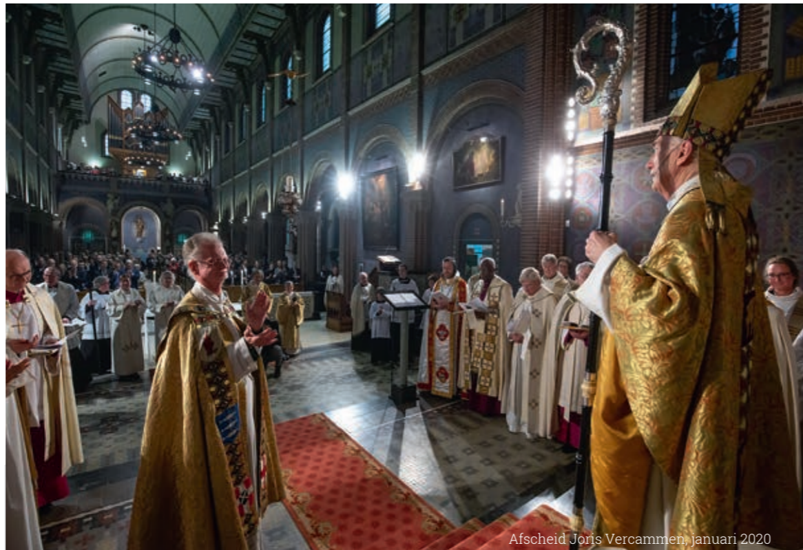
Afscheid Joris Vercammen, januari 2020

Foto omslag: aartsbisschop Joris Vercammen in het spoor van mysticus Dag Hammarskjöld in Zweeds Lapland. De EO documentaire De Pelgrim met Joris Vercammen is nog online te zien.